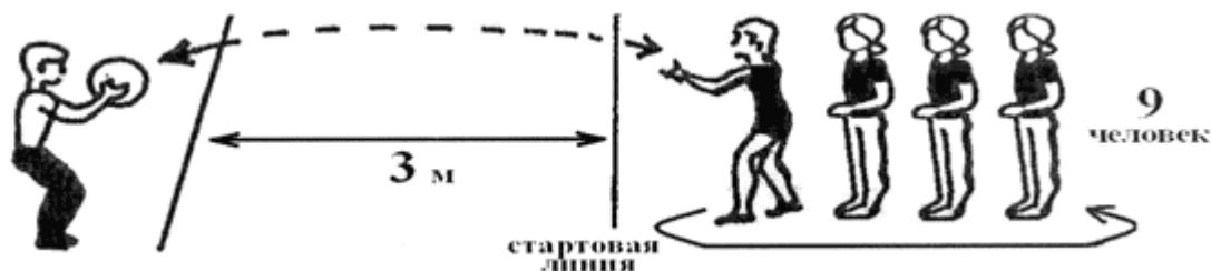
Рис. 1. Эстафета с волейбольным мячом

Эстафета заканчивается, когда у стартовой линии окажется игрок, который первым ловил мяч, брошенный капитаном (см. рис. 1).